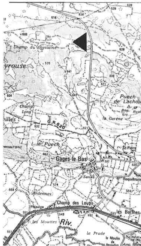
Carte I.G.N. 2439 ouest